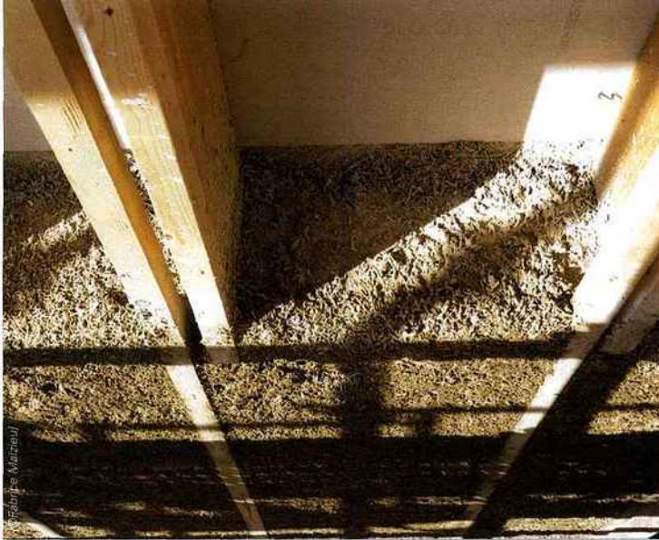
Près d'un mois a été nécessaire pour le flocage du béton de chanvre sur toutes les façades. Vue en contre-plongée

L'ossature métallique du bâtiment se compose de portiques soudés transversaux de hauteur d'étage, livrés préfabriqués à la dimension précise entre mitoyens. Elle est contreventée en sous-face de planchers et en mitoyens. Les planchers en bacs acier ont reçu une chape de 13 cm de béton. L'avantage de l'ossature métallique ? Rapide à monter, elle ne nécessite pas la présence d'une grue en permanence sur le chantier. Cette présence a été limitée à cinq semaines. « C'est un gain énorme pour l'entreprise générale », note Richard Thomas. Il a fallu environ un mois pour monter l'ossature métallique, puis un mois et demi pour élever l'ossature bois, et enfin près d'un mois pour réaliser le remplissage de l'isolation en béton de chanvre. Au total, l'ensemble de l'enveloppe (le clos/couvert) a été réalisé en neuf mois, hors finitions.