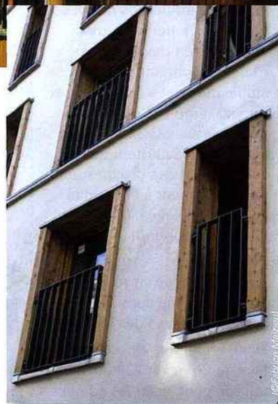
La façade côté rue est plus sobre, avec un enduit à la chaux

Les façades ont été conçues de manière à laisser passer beaucoup de lumière. La façade côté jardin est en bois avec une finition, au dernier étage, en bardage zinc.